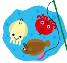
進行役 丸山徹 5年目 趣味：釣り