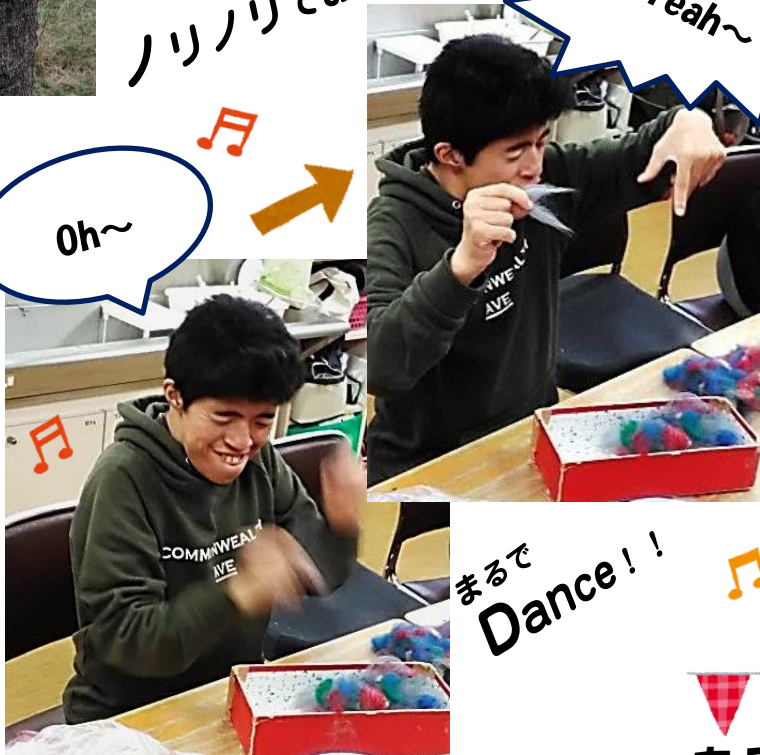
羊毛を細かくちぎってます。