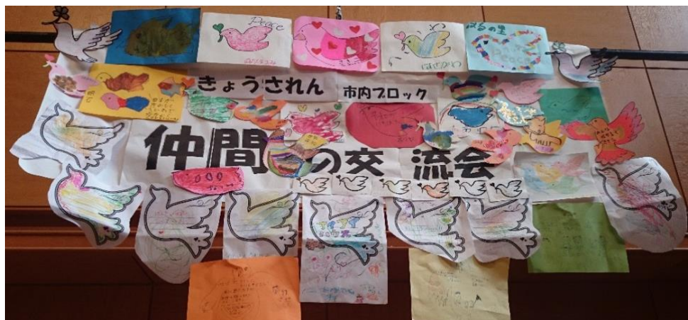
各事業所の仲間の願いが書かれた鳩の看板を作りました