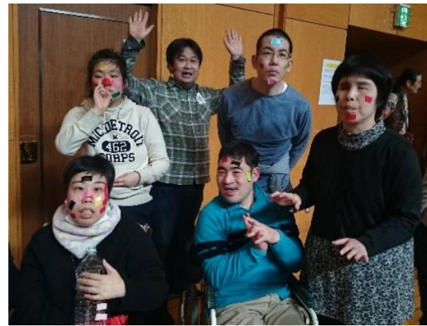
劇団MOMOさんによるミニコンサート&人形劇